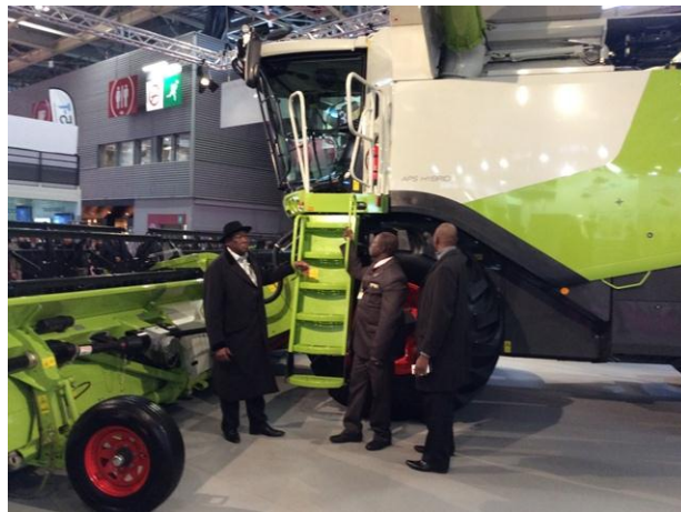
Visite équipements au SIA