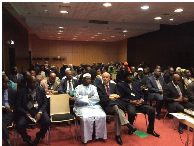
Salle vue de face à la Journée du Mali